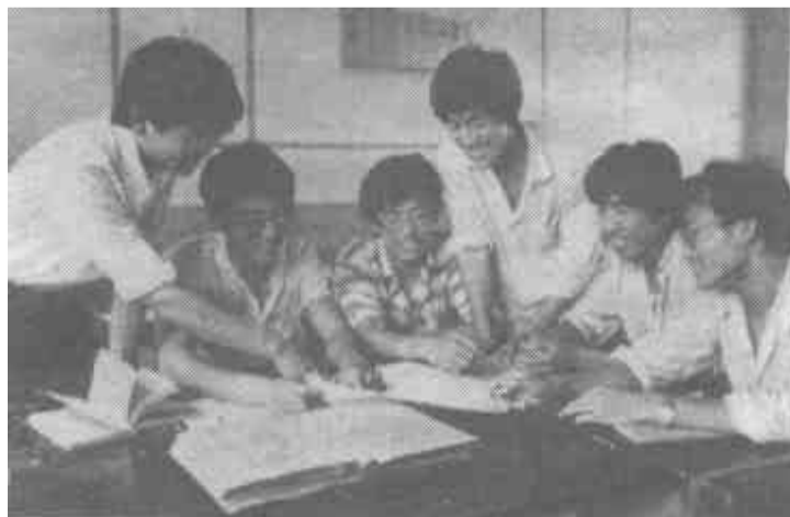
这六位大学生，去年到利津县付窝乡中学任教后，不断进行改革，已成为该校的业务骨干。

本报讯 7月8日上午，市级机关党委在东城大礼堂召开市直机关全体党员干部大会。会议传达了邓小平同志的重要讲话和江泽民同志在四中全会上的讲话；传达了李鹏同志代表中央政治局向四中全会作的《关于赵紫阳同志在反党反社会主义的动乱中所犯错误的报告》；传达了《中共东营市委常委会(扩大)会议关于学习贯彻党的十三届四中全会和省委五届二次全委(扩大)会议精神的决议》。会议要求，各级党组织和共产党员要按照市委的统一部署，紧密结合本单位的实际，认真学习好文件，统一思想，与党中央在政治上保持高度一致，认真贯彻好党的十三届四中全会和省委五届二次全委(扩大)会议精神。