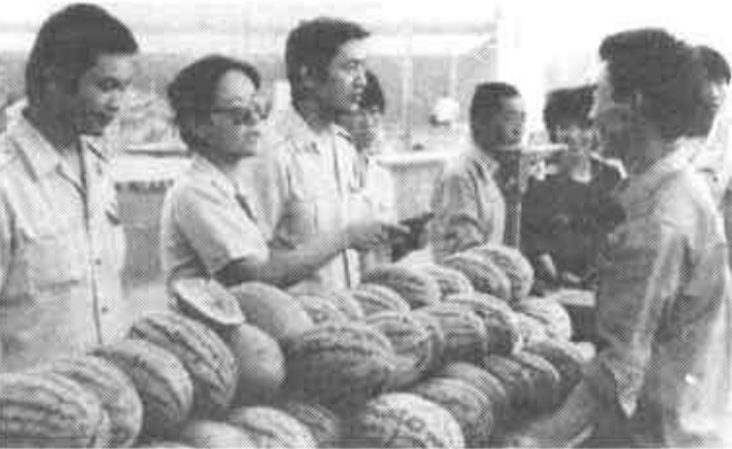
利津县税务部门克服小宗流动性税源零散、征收难度大的困难，坚持深入集市和农贸市场征收税款，到5月底，已提前一个月实现任务过半。图为税务人员在农贸市场征税。

开放搞活使我市个体经济得到迅猛发展，个体户、专业户手中存有大量的资金。东营区工商银行基东储蓄所通过对西城商业街的个体户、专业户的调查，了解到其不愿到银行存款的主要原因，是怕露富，怕支取现金有困难，怕利息低，不实惠。针对这种现象，该所变过去的“等客上门”为登门服务，他们不怕麻烦，深入到个体摊位宣传储蓄政策和知识。同时，办理支票转存业务，对个体户和专业户外出采购给予方便。通过周到热情的服务，使“两户”打消了顾虑，纷纷把现金存入银行。现在，已有11家个体户到该所存款24万余元，有的户一次就存4万余元。(王建生)